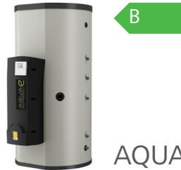
AQUA EXPRESSO III

Die STAqua mono ist die kompakte Solarstation mit wenig Platzbedarf. Die Messtechnik und Regelung der STAqua II haben sich bewährt und kommen auch hier zum Einsatz.